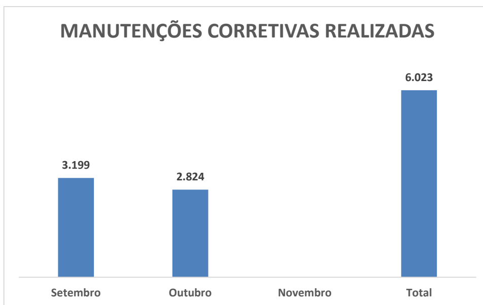
Gráfico 1 – Evolução das manutenções corretivas realizadas

No Gráfico 1 apresenta-se a evolução mensal das manutenções corretivas realizadas, levando em consideração o trimestre de referência.