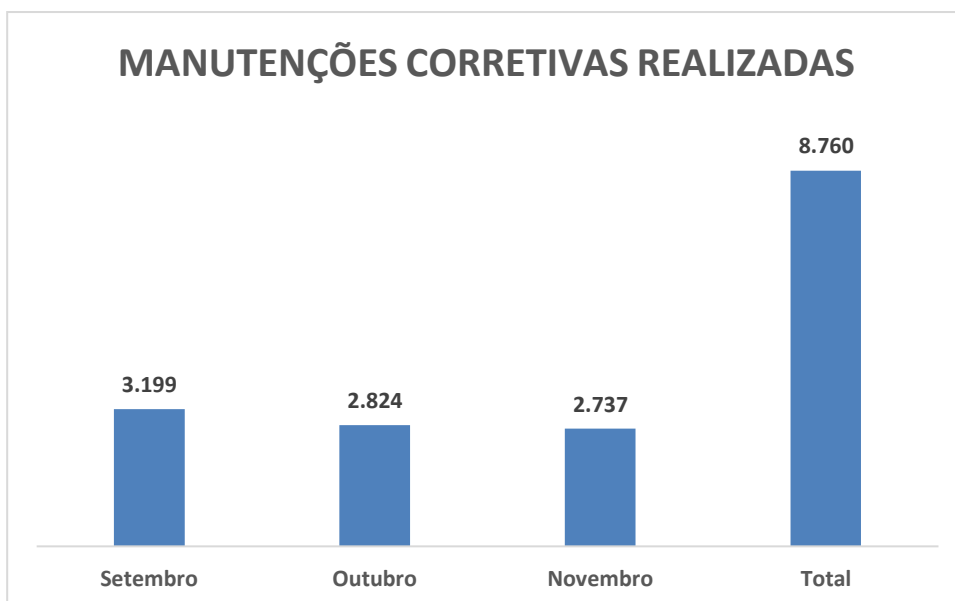
Gráfico 1 – Evolução das manutenções corretivas realizadas

No Gráfico 1 apresenta-se a evolução mensal das manutenções corretivas realizadas, levando em consideração o trimestre de referência.