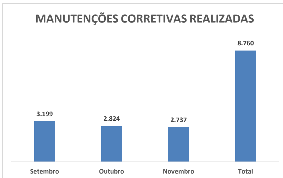
Gráfico 3 – Evolução de pontos vistoriados pelos serviços de ronda

Para o período de referência, foram realizadas rondas no município de Uberlândia registrando no Sistema de Gestão as ocorrências de manutenção corretiva para o atendimento aos problemas encontrados. É apresentado no gráfico 3, a seguir, a quantidade de pontos de IP vistoriados pelas rondas para o período de referência do relatório conforme anexo 03.