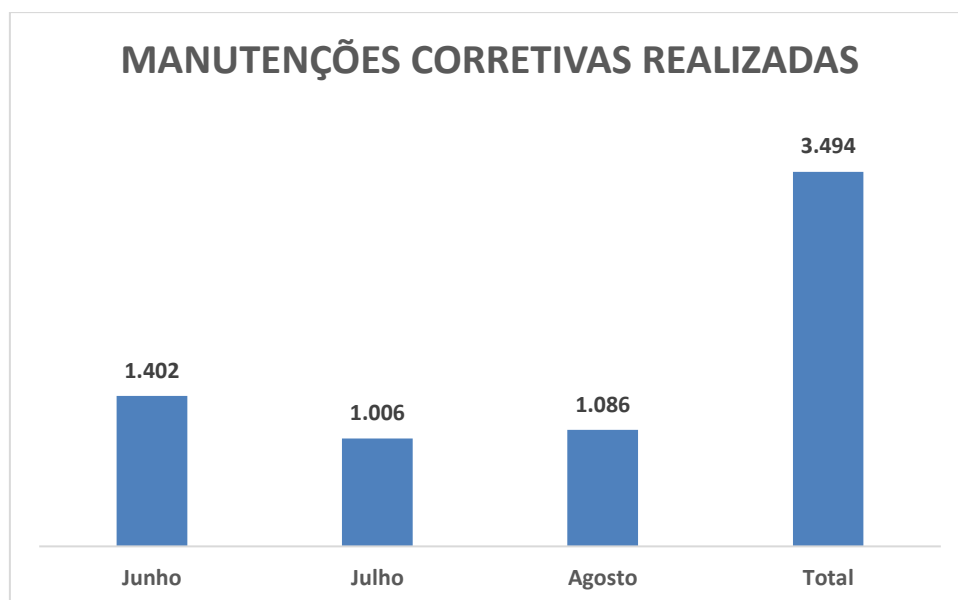
Gráfico 1 – Evolução das manutenções corretivas realizadas

No Gráfico 1 apresenta-se a evolução mensal das manutenções corretivas realizadas, levando em consideração o trimestre de referência.