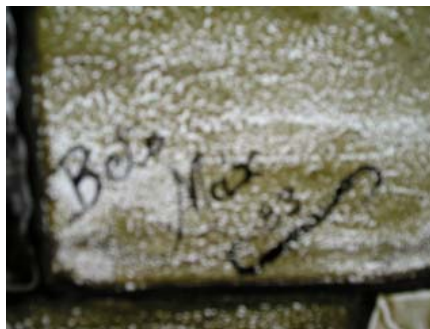
Detalhe Assinatura de Beto Máx