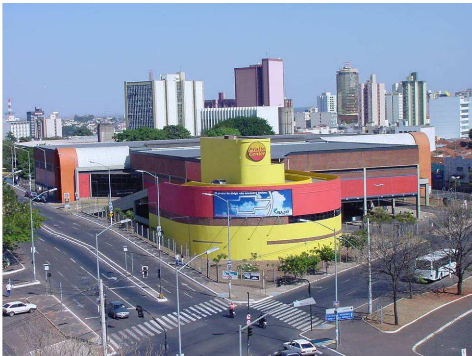
Vista do Terminal Central no ano de 2002.

16 de fevereiro de 2007: Não foram verificados fatores específicos de degradação, apenas o desgaste normal pelo uso intenso de seus espaços. A área verde do Terminal se encontra bem cuidado, com ajardinamentos laterais limpos e podados. Recentes adaptações foram feitas para deficientes físicos e idosos. Importante ressaltar o expressivo comércio estabelecido dentro e ao redor do Terminal Central.